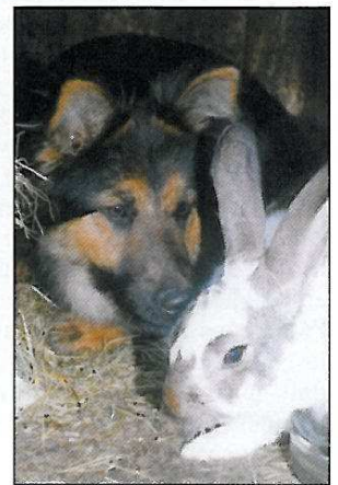
Bea Zazrak et un copain!