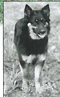
Asta na Barance, née le 20.10.1985