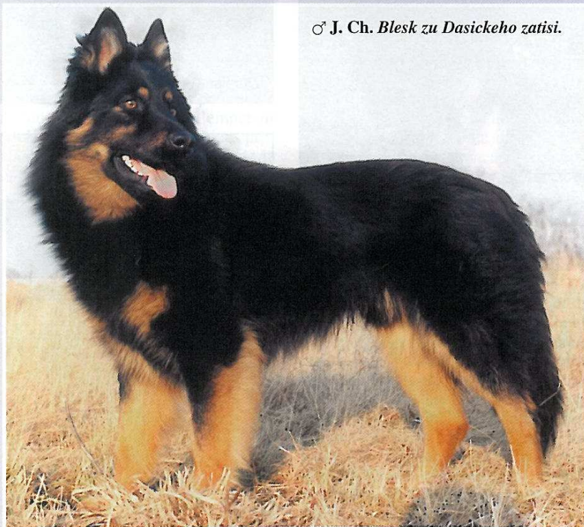
♂ J. Ch. Blesk zu Dasickeho zatisi.

Le corps: légèrement plus long que la hauteur au garrot. Bien musclé.