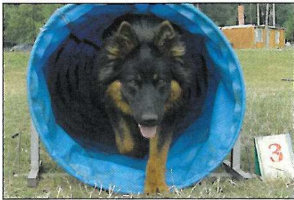
♂ Savan od Strazne skaly.