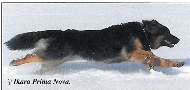
♀ Ikara Prima Nova.