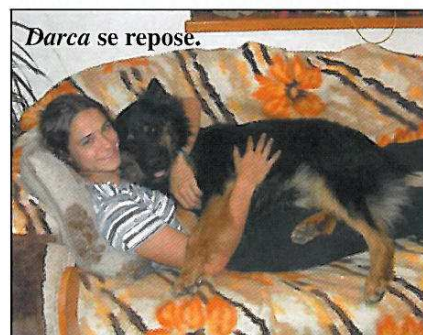
Darca se repose.

La morphologie du chodský est celle d'un chien robuste, avec des aplombs bien campés et une ligne de dos naturellement horizontale. Les oreilles pas trop grandes sont portées haut et dressées, le fouet est porté descendant vers les jarrets et remonte parfois jusqu'à s'aligner à la ligne du dos, lorsque qu'il est en action, sans former une boucle. Ses allures sont souples et il se déplace avec un trot régulier et sans effort apparent, ce qui lui permet de couvrir de longues distances sans trop se fatiguer. Il se présente d'une façon élégante et sans lourdeur.