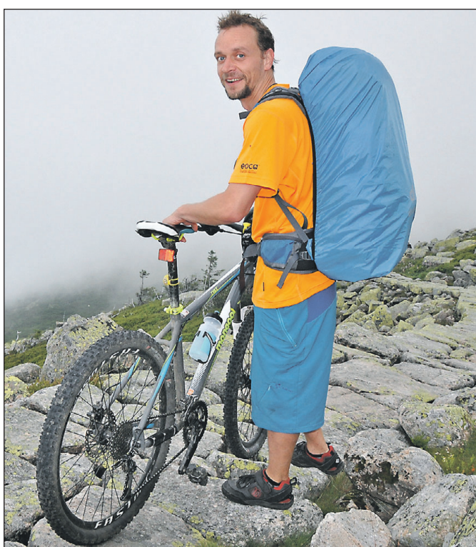
Cyklisty lze potkat na zakázané trase pod Sněžnými jámami.

Spolehlivě uhlídat Krkonoše před neposlušnými cykloturisty není v silách strážců národního parku. „Vezmeme-li v potaz skutečnost, že Krkonoše během léta navštíví statisíce lidí a strážci