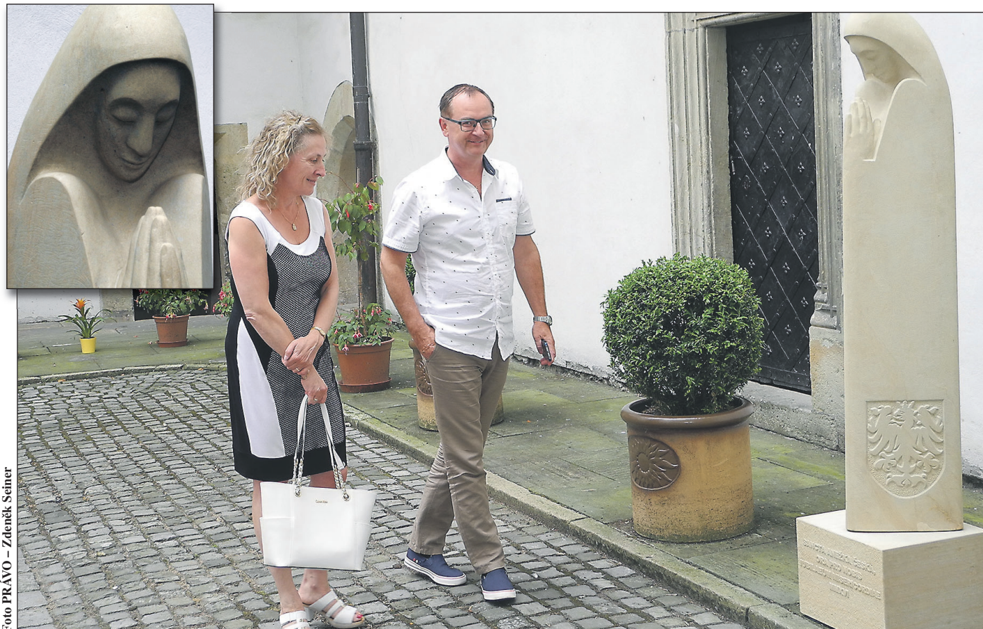
Socha Anežky České zaujala návštěvníky pardubického zámku. Detail tváře ve výřezu.

Ta už delší čas spolupracuje se Střední průmyslovou školou kamenickou a sochařskou v Hořicích v Podkrkonoší a tady objevila sochu, která nejen ji zaujala