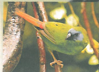
Společný chov amad tříbarvých