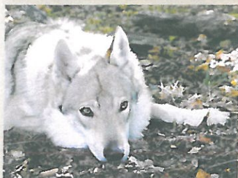
Tajemství psí bolesti