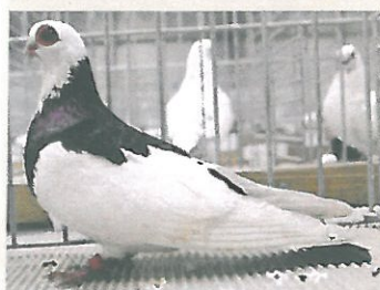
O současném českém holubářství