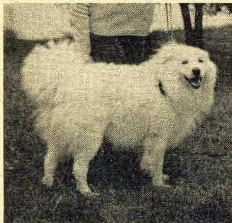
Pozdější obrázek bundáše ve srovnání se slovenským čuvačem

Rekonstrukci karlovarského krysaříka nakreslila M. Říhová, fotografie jsou z archivu doc. ing. V. Kurze. *) Bunda — slovo pocházející z maďarštiny — bunda = pův. uherský kožich; z toho bundáš = huňatý pes.