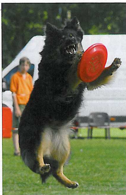
Ch. ČR Darri Stamo-Bud, dvojnásobný mistr Evropy v quadrapedu.

Díky své povaze je vhodný i jako první pes pro začínající kynology, i z řad teenagerů. Je výbor-