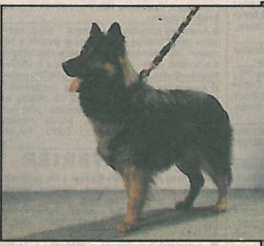
Clark Bryvílsár - VTM, 5xCAC, NV, BOB, OV - Birri Chodský pes x Bela na Bylinkách, maj. O. Bernátová

hovoří i bezproblémová přeprava, lehká ovladatelnost a v neposlední řadě i menší nároky na množství krmiva oproti jiným služebním plemenům. Jeho hustá srst ho chrání před mrazem, deštěm i silným slunečním zářením. Přelínání je krátkodobé, péče o srst je minimální - stačí ji 2x týdně pročesat řídkým hřebenem. Vzhledem k jeho odolnosti ustájení chodského psa nevyžaduje žádná speciфика, stačí nezažehnaná bouda (toto však neplatí pro odchovy štěňat) a jen dodržovat zásadu, že žádný pes jakéhokoliv plemene nesmí být ustájen ve