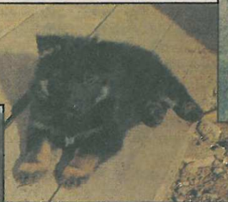
Amo Od devíti bedel