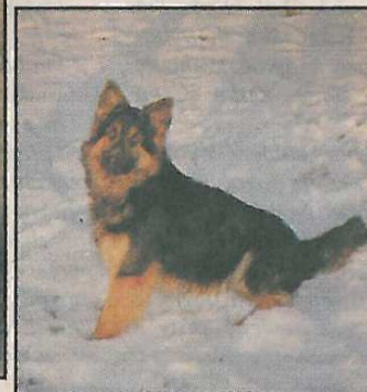
Bredy z Gipova - Bak na Barance x Aneta Chodský pes, maj. J. Jérie, Nýrsko

a zažívá nežádoucí situace nikdy nemůže prokazovat charakteristické vlastnosti plemene. Je nevyhnutelný častý styk s člověkem i okolním světem. Jedinci izolovaní od vnějšího světa se nutně musí stát bojácní a nervózní, což platí pro všechny jedince různých plemen.