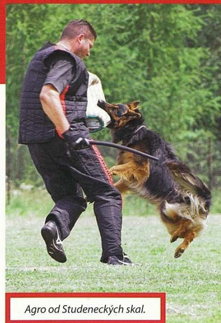
Agro od Studeneckých skal.

Nejvíce chodských psů se zřejmě věnuje všestrannému výcviku, který je stále pro